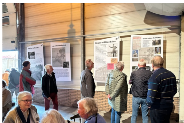
Tenstoonstelling verloop staking Stork 1943