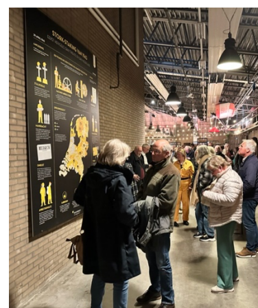
Infographic ontstaan staking